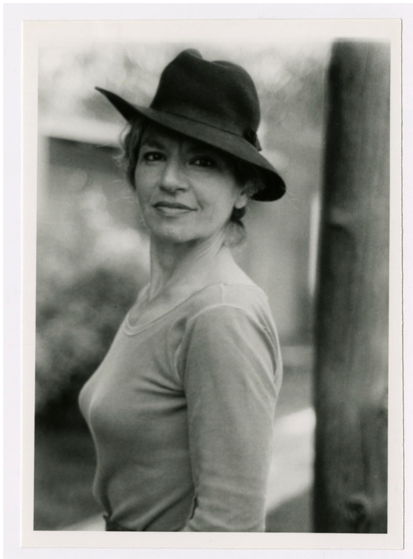
Bette Howland, 1984.

«La Bette Howland va escriure un llibre que jo pensava que era impossible d'escriure» (Yiyun Li, escriptora).