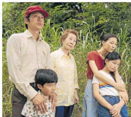
'Minari' és la primera de les projeccions, que tindrà lloc aquest dimecres.

Finalment, el cicle Un estiu de pel·lícula conclourà el dimecres 13 de juliol amb la cinta La sociedad literaria y el pastel de pichel de patata , una adaptació del best-seller homònim escrit per l'Annie Barrows i Mary Ann Schaffer, que dirigeix el britànic Mike Newell. Una història ambientada després de la Segona Guerra Mundial on una jove escriptora un dia rep una carta des de Guernsey, una illa propera a Normandia d'un admirador desconegut que li presenta un curiós club de lectura i decideix viatjar fins allà sense saber que trobarà molt més que una gran història.